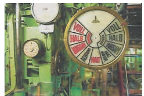
Blick in den Maschinenraum

Ahoi und allzeit gute Fahrt, Ihr Jürgen Pfuhl