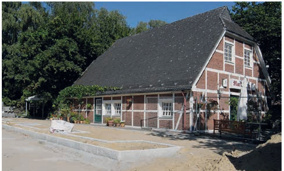
So sah es um das Restaurant „Marktplatz“ Mitte August aus.

In der neuen Krippe, Dependance der Evangelischen Kita an der Rupertistraße, werden seit Anfang August die ersten 15 Kleinkinder eingewöhnt. Dank der geschickten architektonischen und landschaftsplanerischen Gestaltung entsteht zwischen Krippe, Kirchenbüro, Jugendhaus und Restaurant „Marktplatz“ ein großzügiger, neuer Platz mitten im Dorf, der Besucher des Kirchenbüros und des angrenzenden Restaurants zum Verweilen einladen soll.