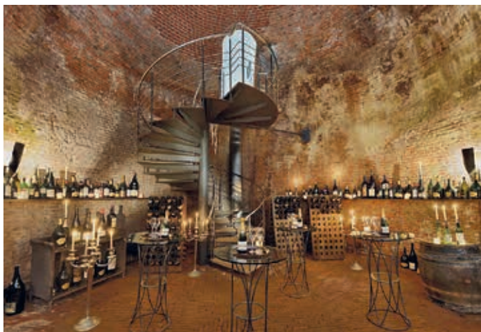
Der Eiskeller im heutigen Zustand

Führungen: Samstag 8. September, 11.00, 12.00, 13.00 und 14.00 Uhr. Treffpunkt: Eingang Lindenterrasse, Vorplatz des Hotels