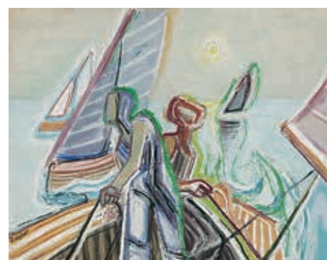
„Das Hauptbild der Ausstellung: Eduard Bargheer, Regatta , 1936, Öl auf Leinwand, Leihgabe aus der Sammlung der Deutschen Bundesbank“.

mungen der Avantgarde der ersten Generation in seinem Werk, das er passend unter das Motto stellte: „Auf dem Wege sein, heißt, nicht zu verharren bei einer Idee, einer Erfindung..., sondern den Mut haben, immer wieder einen neuen Weg einzuschlagen, sich wieder aus dem Bequemen Hafen auf das Hohe Meer des Ungewissen zu wagen“.