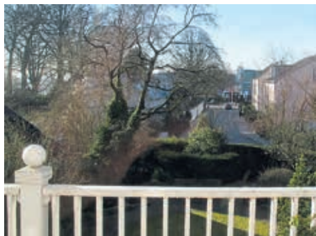
Bild 2. Attraktiver Winterelbblick.

Nach einiger Zeit fand er eine Betriebsgesellschaft GmbH & Co. KG als Pächter dafür, benannt nach der unter Denkmalschutz stehenden Immobilie „Stubbenhof“ in Jesteburg.