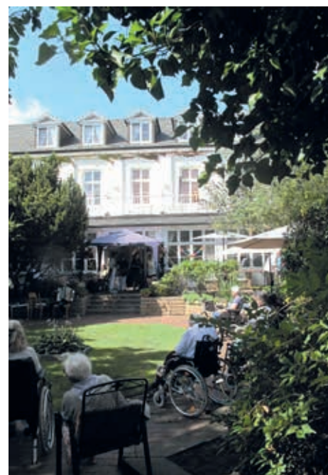
Bild 3. Das letzte Sommerfest