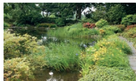
Blühende Landschaft

Der Garten sollte nicht nur Gelehrten zugänglich sein, sondern auch der Hamburger Bevölkerung offenstehen. Doch die Stadt stellte Lehmann lediglich ein Grundstück zur