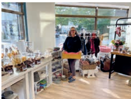
Frau Neve mit der „Hamburger Kiste“