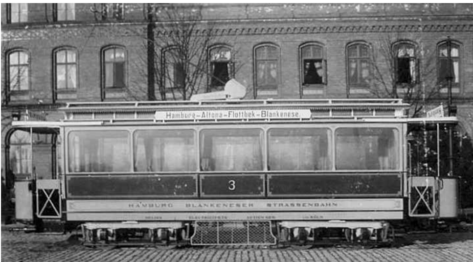
Vierachsiger Triebwagen 3 der „Elektrischen Straßenbahn Hamburg-Blankenese“. Mit solchen vierachsigen Triebwagen wurde Mitte Dezember 1899 der Betrieb aufgenommen. Die Wagenbauanstalt Falkenried hatte die Triebwagen 1899 gebaut. [Foto der Wagenbauanstalt Falkenried vermutlich von 1899]

Seit dem 12. Dezember 1900 laufen die Wagen nunmehr auf der ganzen Linie von Blankenese über Altona durch Hamburg nach Barmbeck. Die Länge der ganzen Bahnlinie beträgt 19,4 km, wovon der ausserhalb Altonas gelegene Abschnitt von der Treskallee bis zur Endstation Blankenese 8,4 km ausmacht.