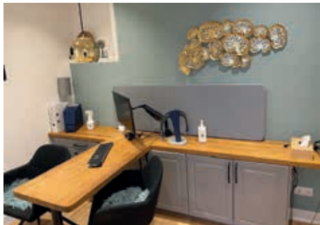
Einer der neuen Anpassräume

Durch die Vergrößerung stehen jetzt 100 m 2 anstatt 60 m 2 zur Verfügung und im 1. Stock gibt es noch zusätzlich Büroraum. Hierdurch wurde es jetzt möglich, 2 Anpassräume vorzuhalten, sowie ein Vorführraum für alle drahtlosen TV-Geräte, Anbindungen mit Hörgeräten, z.B. Sennheiser zum Testen.