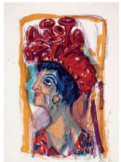
Otto Dix: Contessa, 1962, Farblithographie, Sammlung Ernst-Joachim Sorst, Hannover, C VG Bild-Kunst, Bonn, 2021, Foto Werner Herling