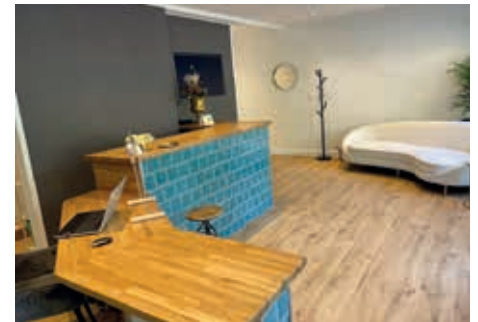
Eingangsbereich mit Wohlfühlambiente