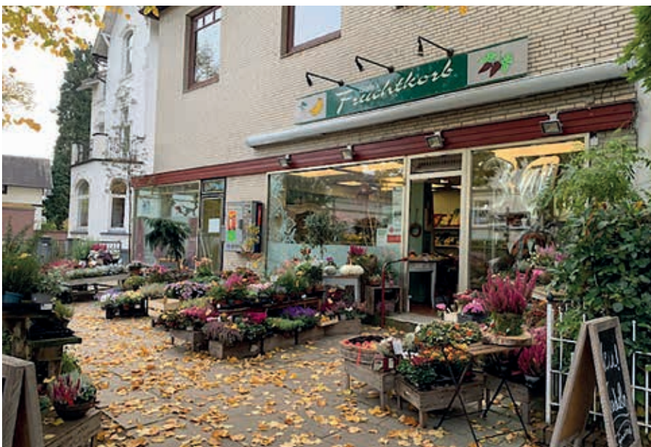
Der „Fruchtkorb“ mit seiner herbstlichen Deko-Pracht