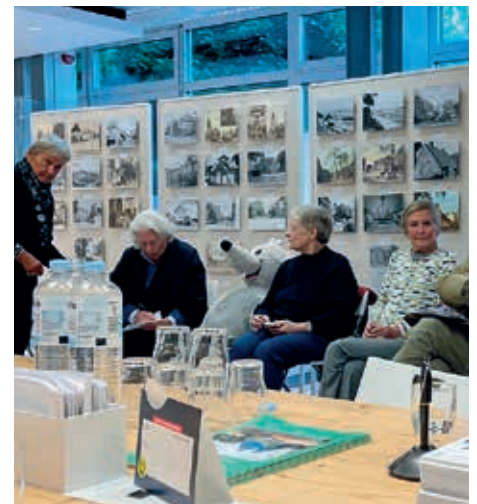
Selbst das Maskottchen der Haspa, die Maus, mischte sich unter die Teilnehmer.

Die Hauptversammlung ist um 19.00 Uhr beendet.