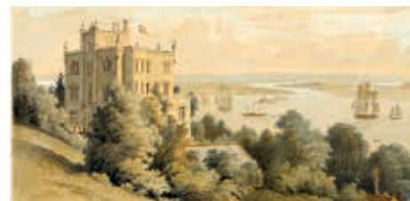
Das Schiller-Landhaus bei Neumühlen an der Elbe (von Nordwesten nach Südosten gesehen), Lithographie von Wilhelm Heuer, ca. 1860

ren. Seine Eltern starben früh und so wuchs er zusammen mit seinem jüngeren Bruder bei einer Tante auf. Herangewachsen gründeten die beiden Brüder in der Gröningerstraße die Firma „Gebrüder Schiller & Co“, die sie äußerst erfolgreich immer weiter ausbauten. Dabei halfen sicherlich die unterschiedlichen Charaktere der beiden Brüder, die sich perfekt ergänzten. Wilhelm war eher bedächtig und sparsam, während Gustav ganz den Typ des groß denkenden und in die Zukunft planenden Unternehmers darstellte. Und dank des geschäftlichen Erfol-