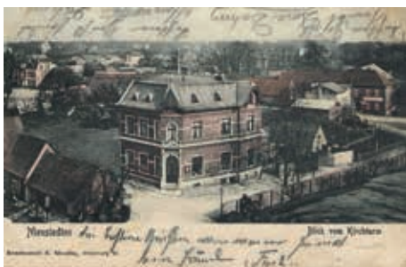
Postkartenansicht des Hauses von 1904