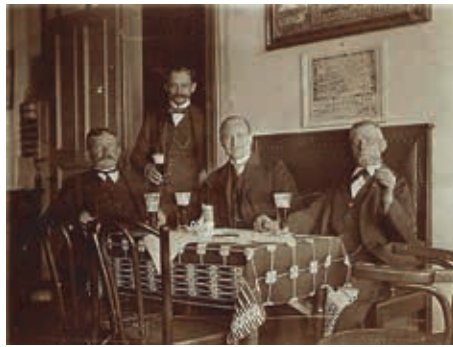
Unbekannte Kneipengänger bei Schnepel um 1920

Dort entwickelte er ein völlig neues Konzept für das Haus. Ein umfangreiches Therapieangebot und Kurse für Prävention sollten die Praxis attraktiv machen. Die Idee eines „ambulanten Therapiezentrums“ war geboren. Meurer renovierte und erweiterte das ehemalige Kurmittelhaus und schaffte neue Therapiemöglichkeiten und Räume. Er engagierte sich in etlichen Gremien und erhielt 2001 die silberne Ehrennadel seines Verbandes für sein Engage-