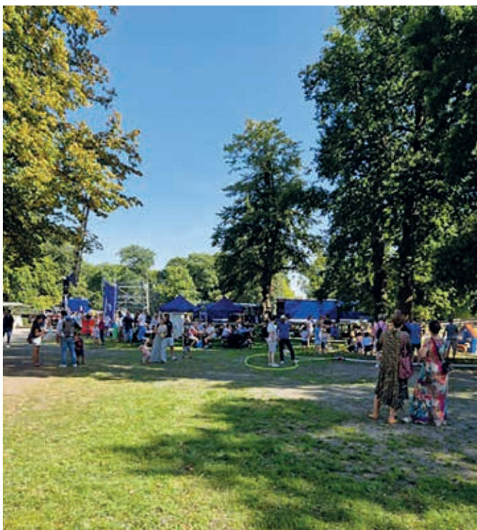
ein fröhliches Sommerfest