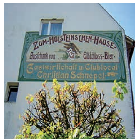
Die denkmalgeschützte Reklametafel (E. Eichberg)

2001 war Schluss mit der Museumsgalerie; der Eigentümer plante umfangreiche Umbauten und die