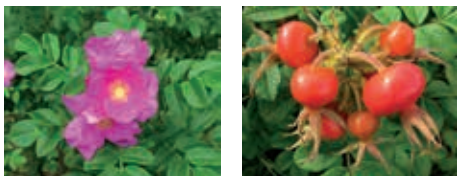
Kartoffelrose .. und ihre Früchte

Beinahe überall finden sich bei uns die robusten Kartoffelrosen, sie säumen Straßen und Gärten, Böschungen und Bahndämme. Im Sommer erfreuen sie uns mit ihren großen, kräftig rosafarbenen oder weißen Blüten, jetzt im Herbst mit ihren dicken roten Hagebutten. Sie sind ein so vertrauter Anblick, dass man meinen könnte, sie entstammten der heimischen Flora, aber in Wirklichkeit sind sie im Osten Asiens beheimatet. Erst am Ende des 18. Jahrhunderts gelangte die Kartoffelrose ( Rosa rugosa ) nach Europa und machte sich rasch als Zierpflanze beliebt.