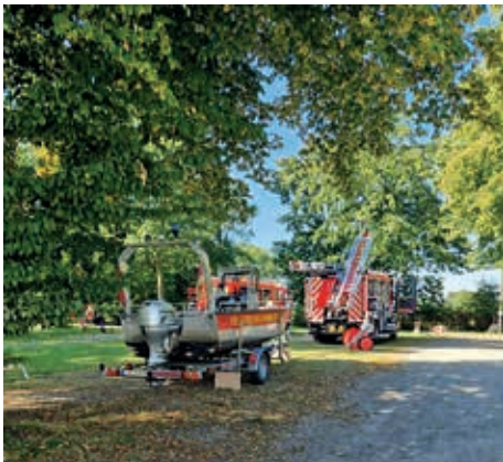
Die Ruhe vor dem Sturm.... (C. Pahnke)

Bei der Hitze sehr beliebt war auch das Spritzen mit der Kübelspritze, mit der die Kinder das „brennende“ Holzhaus löschen konnten. Die Jugendfeuerwehr verkaufte wie jedes Jahr ihre frisch gebackenen Waffeln und das Kuchenbüffet war ebenfalls reichlich gedeckt! Am Bierwagen herrschte großer Andrang und trotz der Hitze fanden auch die Würstchen guten Absatz. Alle Kameraden