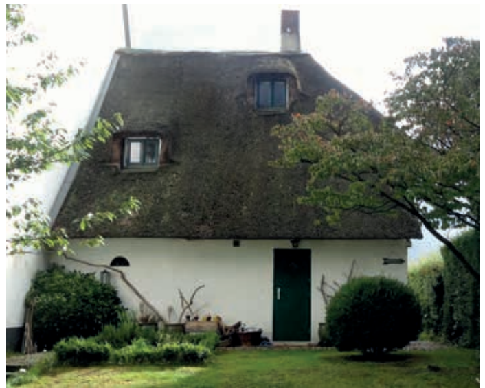
Rückseite mit „Klöndör“