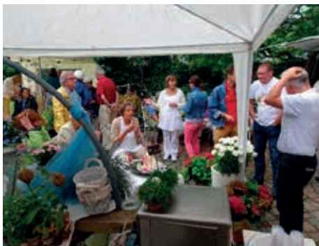
Besucher bei Kaffee und Kuchen