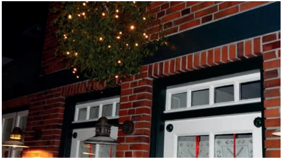
Die beleuchtete Mistelkrone