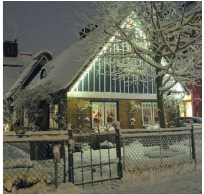
Das Ladiges-Haus im Winterkleid