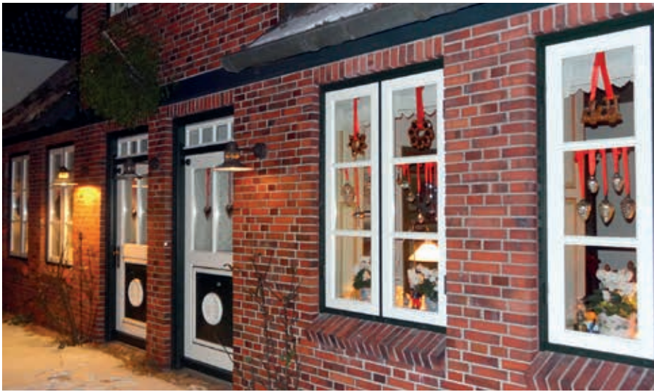
Die weihnachtlich geschmückte Hausfront in der Georg-Bonne-Strasse

etwas anzugleichen, hatten Andre- sens die Idee der Dachbegrünung . Für diese Art der Gestaltung gibt es heute mit Krallen ausgestattete Kunst- stoffmatten, die bepflanzt werden können. In diesem Falle wurden nor- wegische Moose und Sukkulenten eingeflochten. Diese Art Rollrasen, wird dann nur an den vier Dachsei- ten befestigt und bedarf keiner Pfl- ge. Obwohl die Südseite stärker aust- rocknet, muss auch diese bepflanzen- te Fläche nicht gewässert werden und sieht deshalb auch im Sommer fast wie ein Reetdach aus, was letztlich Sinn der Sache war. Interessant in diesem Zusammenhang ist, dass da- mals bei der Feuerwehr am Berliner Tor ein Teilstück des begrüneten Da- ches „eingereicht“ werden musste, um es mit Raketen und Böllern auf Feuerfestigkeit testen zu können. In- zwischen ist es von der Feuerkasse als Hartdach anerkannt. Herr Andre- sen meinte dazu, dass man damals auf die Schnelle keinen Präzedenz- fall schaffen wollte.