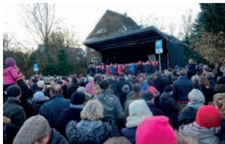
Hunderte stolzer Eltern hören gerührt zu

Da die Bühne schnell gefüllt war, mussten sogar einige Schüler vor der Bühne Platz nehmen. Wie jedes Jahr war ihr Auftritt ein voller Erfolg.