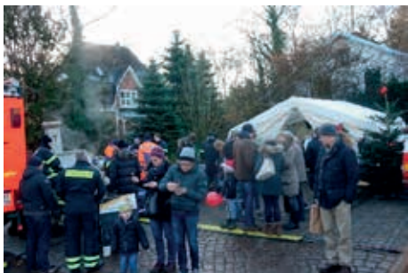
Freiwillige Feuerwehr Nienstedten

Klarer blauer Himmel, strahlender Sonnenschein und die richtige Temperatur für Glühwein. Besser hätte das Wetter nicht sein können. Schon um 13.00 Uhr, direkt nach den musikalischen Klängen des Bläserquartetts kamen die ersten Besucher. Bei der Feuerwehr gab es wieder die traditionelle Erbsensuppe und die leckeren Würstchen von Grill.