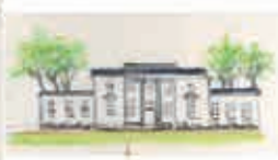
6 Landhaus J. C. Godeffroy