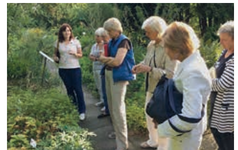
Hört hier die neue Hexengeneration zu?