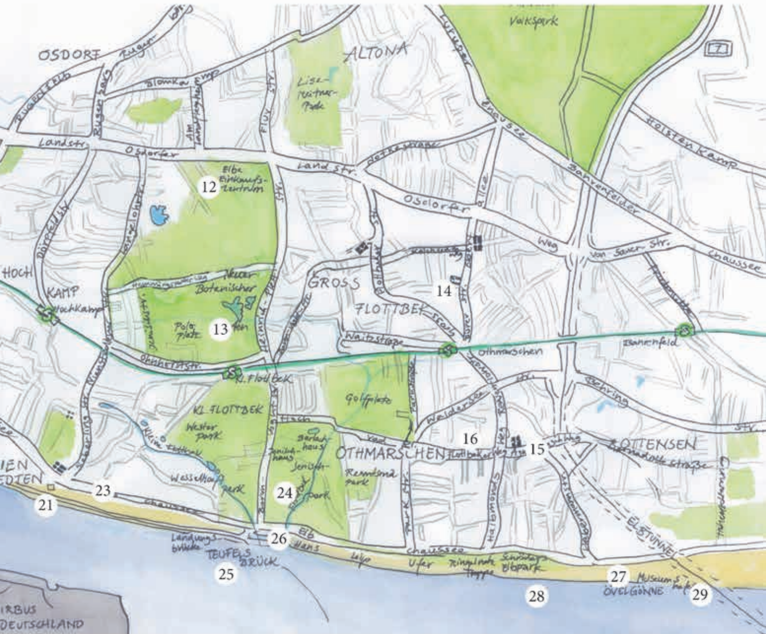
23 Mühlentor 24 Jenischhaus 25 Teufelsbrück 26 Teufel 27 Övelgönne 28 Alter Schwede 29 Museumshafen Övelgönne