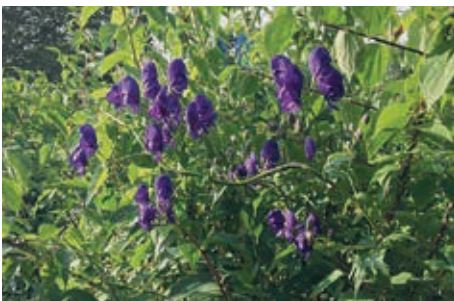
Die blühende Eisenhutpflanze