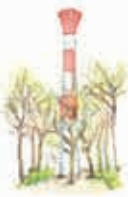
8 Leuchtturm Burs Park