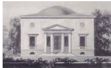
Eine Reproduktion der Tuschezeichnung des Architekten Christian Frederik Hansen