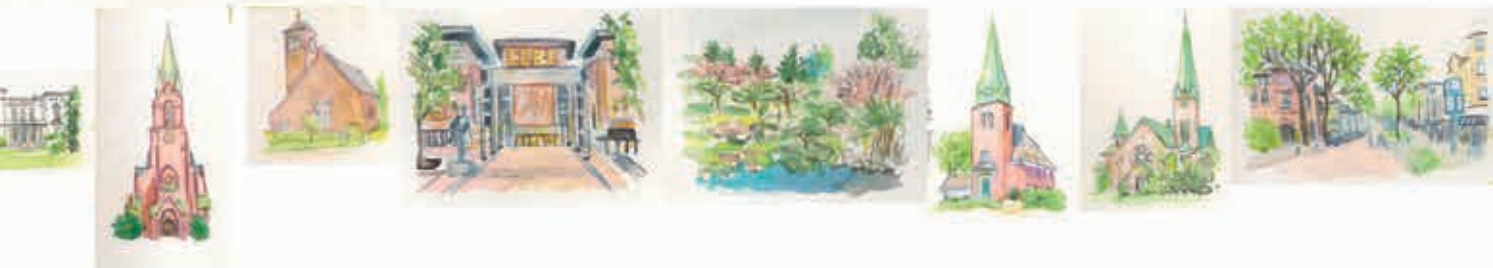
9 Karinenhof 10 Blankeneser Kirche 11 St. Michael Sülldorf 12 Elbe Einkaufszentrum 13 Botanischer Garten 14 Kirche Groß-Flottbek 15 Christus-kirche Othmarschen 16 Waitzstraße