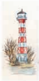
1 Leuchtturm Falkenstein