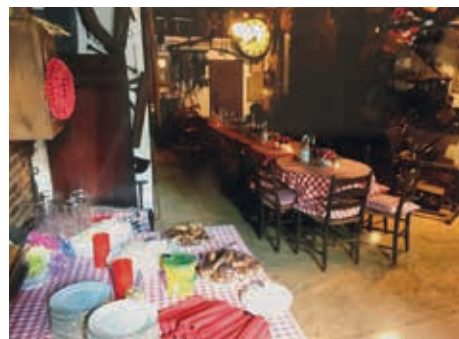
Alles ist bereit für die Gäste.