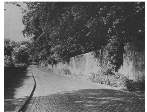
Mauer entlang der Elbschlossstraße

Mit der Zeit verwilderte der einst so prächtige Park mit dem Herrenhaus und den übrigen Gebäuden. Der