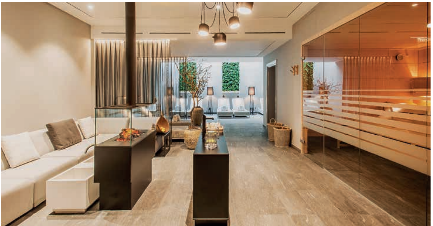
Der neue Wellness-Bereich