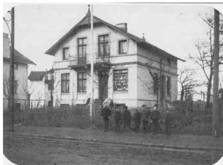
Bild 2. Das Haus des Klempnermeisters Wulff Ecke „Hummelsbüttel-Schanzenstraße“ um 1906. Es fuhr noch die Straßenbahn vorbei. Unter den wartenden Kindern ist auch des Hausbesitzers Tochter Mariechen.