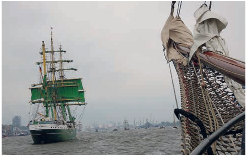
Bug der Fortuna mit Blick auf die Alexander von Humboldt

Also um 15.30 hieß es Leinen los! Ab Teufelsbrück zum Sammeln in Richtung Blankenese, überholt von Großseglern und kleinen Motorbooten. Es war ein Erlebnis. Die 40 Gäste genossen das Spektakel auf Deck, später als der Wind und Kälte zunahmen, auch unter Deck bei Kaffee und Kuchen.