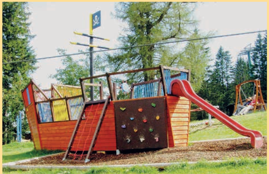
So könnte das Piratenschiff aussehen