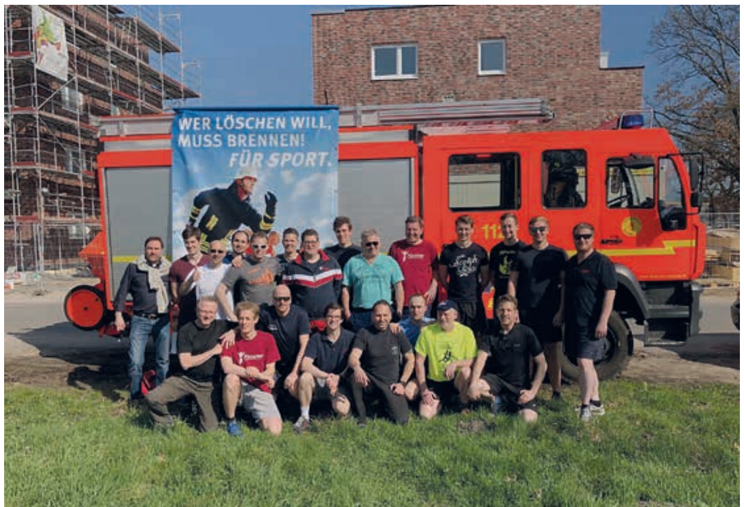
Unsere stolze Truppe