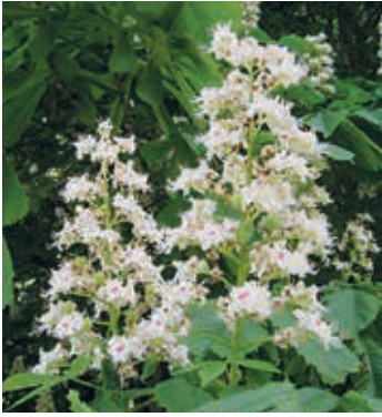
Aesculus hippocastanum

anfällig für andere holzzerstörende Pilze, so dass manch ein liebgewordener Alleebaum nicht mehr gerettet werden kann.