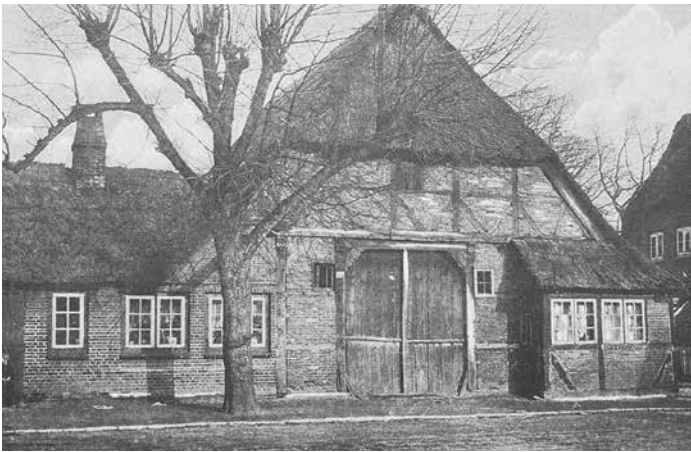
Bild 1. Am Marktplatz Ecke Schulkamp vor 100 Jahren.