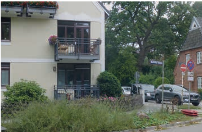
Bild 2. Die gleiche Ecke wie Bild 1 heute

Die inzwischen noch älter gewordene Linde musste kürzlich gefällt werden. Sie gefährdete Fußgänger und Autos. Die Wunde muss nun langsam verheilen. Der natürliche Schorf auf der Narbe ist zu einem botanisch interessanten Biotop geworden ( Bild 2 ): Zu einer Sukzessionsfläche inmitten städtisch/dörflichen Verkehrs. Ein Anwohner hatte sich einst zu Füßen des Baumes mit Tulpen um eine gärtnerische Gestaltung bemüht, nun hat er aber aufgegeben. Mal sehen, wie sich die kleine Fläche weiterentwickelt. Vielleicht kann sie bald unter Naturschutz gestellt werden.