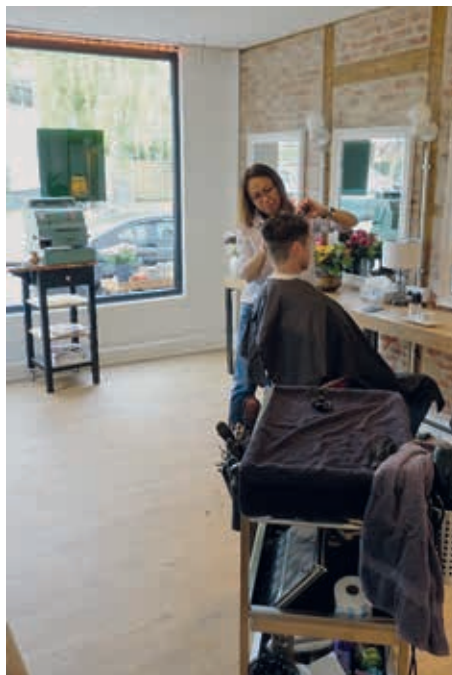
Frau Townao bei der Arbeit

2013 hat Sie sich in einem Friseursalon in Othmarschen selbständig gemacht mit einigen