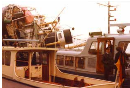
Bergungsaktion der WIEDAU

Am besagten Tag, um 19.03 Uhr, kollidierte im Nebel (Sichtweite 50 m) das 1954 gebaute Küstenmotorschiff WIEDAU mit dem entgegenkommenden polnischen Frachter M. KALINOWSKI, drehte sich, um danach mit voller Wucht das Binnenschiff UWE zu rammen. Der Schiffsführer der UWE konnte sich noch an Bord der WIEDAU retten, bevor beide Schiffe (UWE und WIEDAU) kenterten und sanken. Die 16 Mann Besatzung der WIEDAU sprang ins Wasser, schwamm an Land und wurde dort von den Bewohnern des nahen gelegenen Altersheimes empfangen und versorgt. Ein Seemann kam