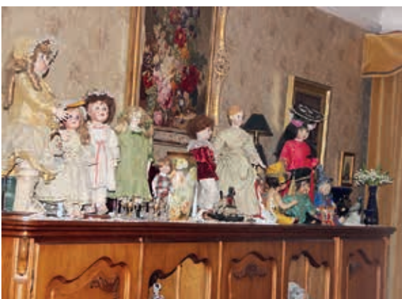
Puppenversammlung auf der Anrichte