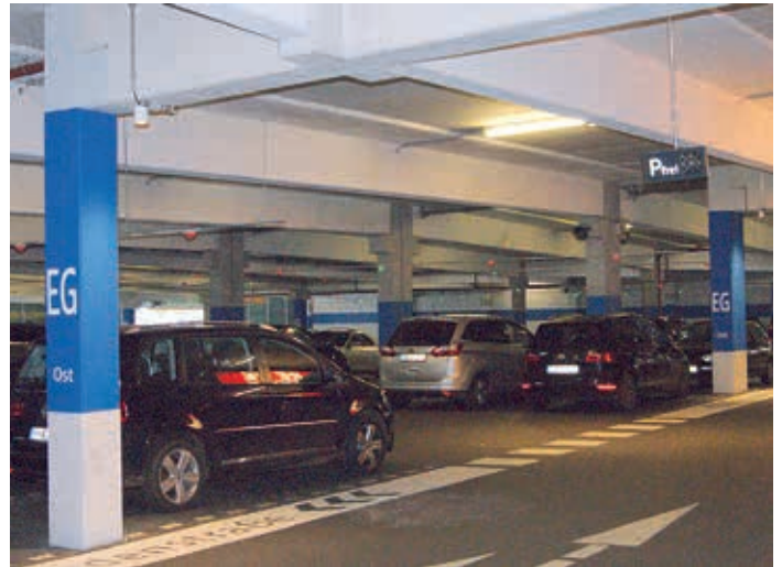
Das Ampelsystem in den Garagen