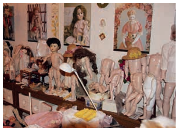
Warten auf die Endmontage....