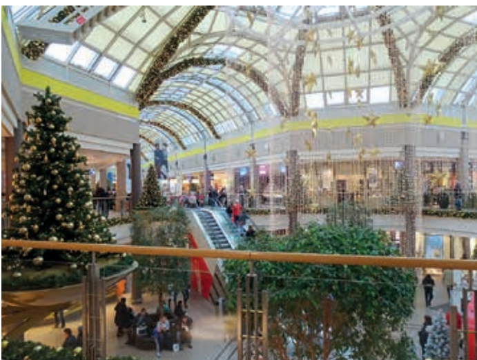
Vorweihnachtliche Stimmung im EEZ

Wobei ich nun beim eigentlichen Thema wäre: dem festlich gestalteten Einkaufszentrum. Da wäre in der Mitte des Zentrums der riesige Lichtervorhang mit 45 Sternen zu bestaunen, dann die über 70 dicken Girlanden an den Decken und Gängen, die 40 beleuchteten Tannenbäume, von denen sich 12 sogar langsam drehen und die vielen großen Gestecke. Und was die ständig wechselnde Beleuchtung an der Nordseite - Haupteingang Osdorfer Landstraße - betrifft, so wurden dort 120 Sterne angebracht und insgesamt über 1000m LED-Lichterkette verlegt. Schön zu sehen, da der Blick nicht durch das Laub der Bäume behindert wird. Wären noch die Fragen zu beantworten, wann und wie das alles geschieht. So erfuhr ich vom Center Manager Gerhard Löwe, dass die sehr aufwendigen Arbeiten im November fast vier Wochen in Anspruch nehmen und wegen der Unfallgefährdung nur nachts