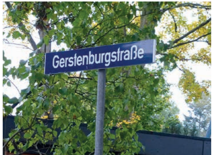
... und das neue