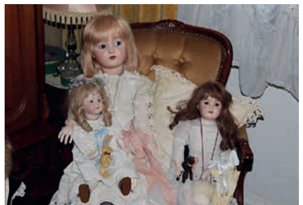
Wer ist die Schönste von uns drei?...