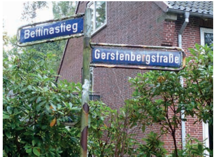
Die alten Straßenschilder

Mit Bezug auf die Beschreibung der Straßennamen im „Dichterviertel“ von Regina Harten im HEIMATBOTEN 9/2014 anbei ein entdeckter Druckfehlerteufel auf dem neuen Straßenschild an der Ecke Charlotte-Niese-Straße.