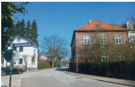
Bild 1. Willkommen im Dorf!

Ein kurzer Rückblick (sh. HEIMATBOTE 2018 H.5): Die im vorletzten Jahrhundert entstandene, ehemals größte Gastronomie im Dorf ( Bild 1 ), mit Ballsaal und Hotel, verfiel nach dem Ersten Weltkrieg. Luxuswohnungen an diesem „Filetstück“, teilweise mit Winterelbblick ( Bild 2 ), daraus zu machen, scheiterten am Denkmalschutz. Ende der 80er Jahre hatte das Gebäude endlich eine damals wirtschaftliche Nutzung gefunden: Ein privater Investor hatte zur Sicherung seiner Lebenseinkünfte die schöne Idee, in solchen Immobilien kleine, persönliche Alten- und Pflegeheime zu betreiben, z. B. auch jenseits der Elbe in der Heide.