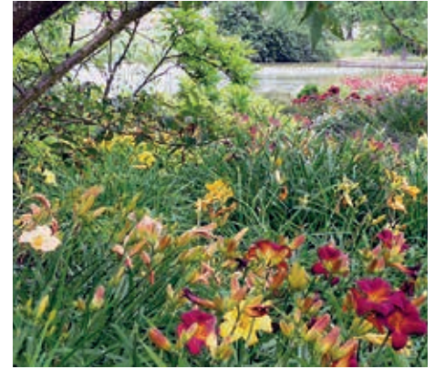
Prächtige Taglilien mit Blick auf den Karpfenteich

N.B.: Ironie der Geschichte: Haben bzw. hatten wir Hamburgerinnen und Hamburger heute, 200 Jahre nach der Eröffnung des Botanischen Gartens, durch die Corona-Pandemie unter Reisewarnungen und Ausgangssperren zu leiden, sollten wir uns einmal bewusstmachen, wie stark die Bewegungsfreiheit unserer Ur-Ur-Ur-Großeltern eingeschränkt war. Und zwar während des ganzen Jahres! Auch hier ging es um die Sicherheit der Menschen, wenn auch nicht nur: Das dicht besiedelte Hamburger Stadtgebiet wurde von mächtigen Befestigungsanlagen geschützt, dem Wallring. Hinein und hinaus gelangte man durch die Stadttore, an die heute nur noch Namen wie Millerntor erinnern. Je nach Jahreszeit wurden sie morgens zwischen 4:30 und 7:00 geöffnet und abends zwischen 16:30 und 21:30 geschlossen. Wer erst nach Toresschluss kam, musste entweder draußen bleiben, oder - je nach Ankunftszeit - einen gestaffelten Obolus entrichten; eine beträchtliche Einnahmequelle für die Stadt! Das erschwerte natürlich den Besuch von Wirtshäusern außerhalb Hamburgs, aber auch des Botanischen Gartens. Und Sonntagsausflüge