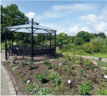
Der neue Rosengarten

gann 1952 als Technischer Leiter des Gartens, wirkte aber als inoffizieller Gartendirektor. 1953 fand bereits die erste Internationale Gartenbauausstellung (IGA) am Dammtor statt, die vorwiegend auf dem angrenzenden Gelände von Pflanzen und Blumen ausgerichtet wurde. So weit, so gut, doch zur IGA '63 sahen die Botaniker rot: Die Ausstellungsflächen sollten weitaus größer sein und der Botanische Garten als Durchgang dahin - ohne Gespür für die Örtlichkeiten - umgestaltet und zugestrichelt werden. Nach lautstarkem Protest der Botaniker und der Bevölkerung, der ein riesiges Presseecho hervorrief, wurden die Pläne aufgegeben - und der Alte Botanische Garten vorteilhaft umgestaltet. Damals entstanden auch die lang vermissten neuen Schaugewächshäuser, die geschickt von Architekt Bernhard Hemkes an einen Hang angelehnt wurden und nicht als gläserner Fremdkörper mitten im Gelände auffallen.