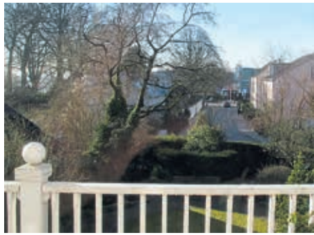
Bild 2. Attraktiver Winterelbblick.

Nach einiger Zeit fand er eine Betriebsgesellschaft GmbH & Co. KG als Pächter dafür, benannt nach der unter Denkmalschutz stehenden Immobilie „Stubbenhof“ in Jesteburg.