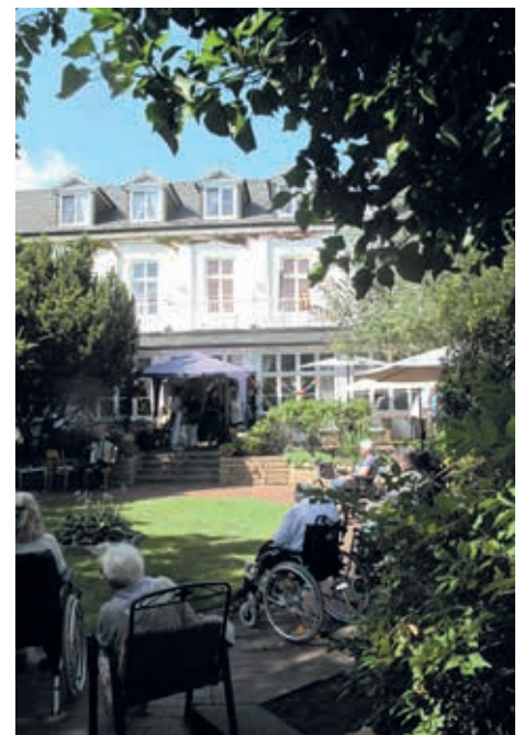
Bild 3. Das letzte Sommerfest