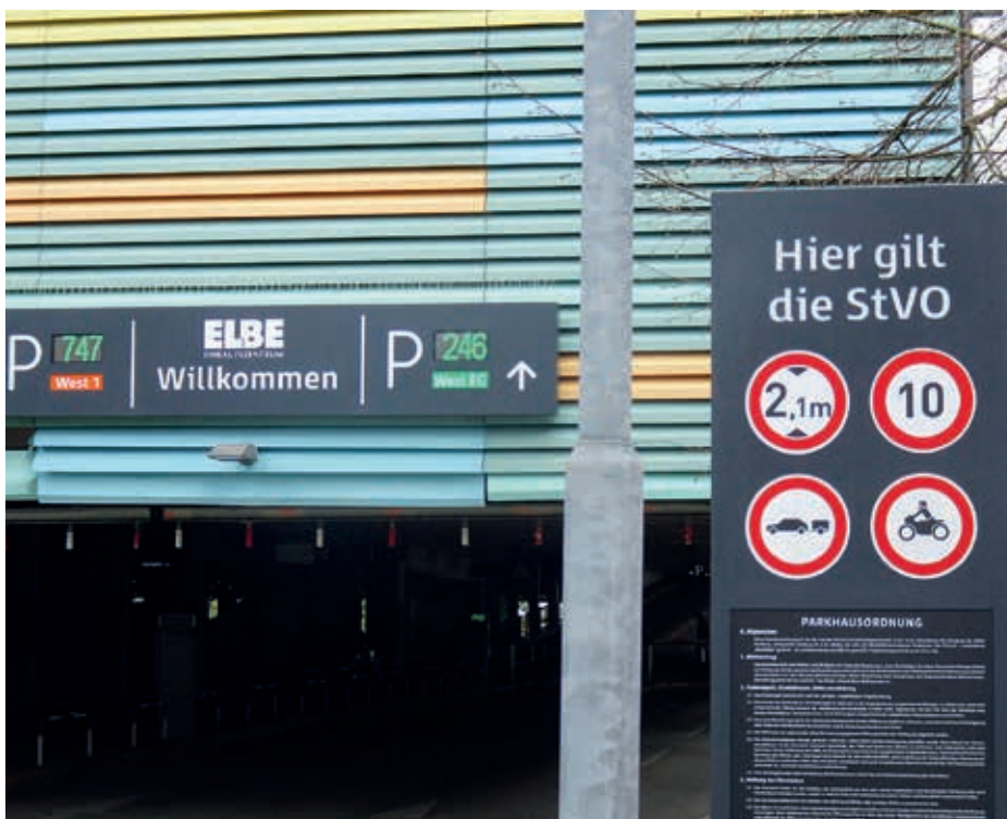
Einfahrt ins Parkhaus mit Hinweisschildern

In diesem Sinne gute Fahrt und vorsichtiges Ein- und Ausparken. Vielleicht piept ihr Auto schon.