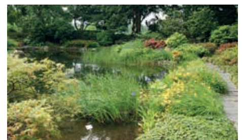
Blühende Landschaft

Der Garten sollte nicht nur Gelehrten zugänglich sein, sondern auch der Hamburger Bevölkerung offenstehen. Doch die Stadt stellte Lehmann lediglich ein Grundstück zur