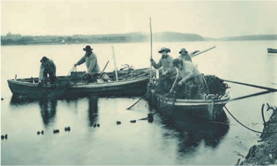
Jollenfischer bei der Arbeit um 1890

Aus dieser Urform entwickelte sich der sogenannte Fischewer mit größerer Segelfläche und oft mit einem zweiten Mast. Gefischt wurde hauptsächlich mit der Baumkurre, einem sackartigen Netz, das über den Grund des Stroms geschleppt wurde. Diese Art der Fischerei war jedoch äußerst schwierig und gefährlich, da die Boote wegen ihres platten Bodens nur schwer zu manövrieren waren, erst recht bei aufgewühlter See. So waren die Verluste an Booten und Mannschaft in den letzten Jahrzehnten des 19. Jahrhunderts beträchtlich.