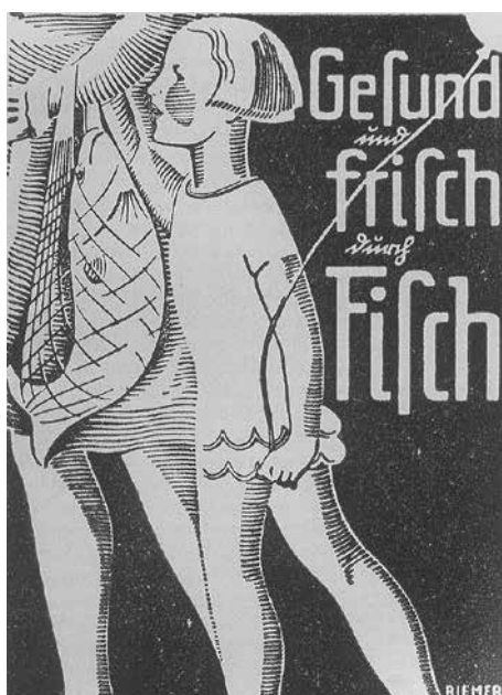
Werbeplakat um 1925

Etwas größer und bequemer war der Ewer, den es schon im 18. Jahrhundert auf der Elbe gab. Der ursprüngliche Typ war der einmastige Pfahlewer, über den es in einem alten Werk heißt: „ Ever ist ein Fahrzeug, hinten und vorn spitzig, mit einem platten Boden, einem Segel und Riemen oder Ruders “. Zur Aufbewahrung des Fanges gab es eine Bunn, einen quer über das Schiff verlaufenden Fischkasten, der vom Wasser durchströmt wurde. Die größten Pfahlewer waren bis zu 17 Meter lang und bis zu 5 Meter breit, ohne festes Deck mit nur einem Vordeck, unter dem sich eine Kajüte für die Mannschaft befand. Diese bestand seit alters her aus Schiffer, Knecht und Jungen. Gefischt wurde mit Stellnetzen, die quer zum Strom versenkt wurden.