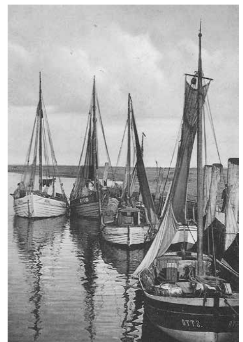
Fischerboote in Otterndorf