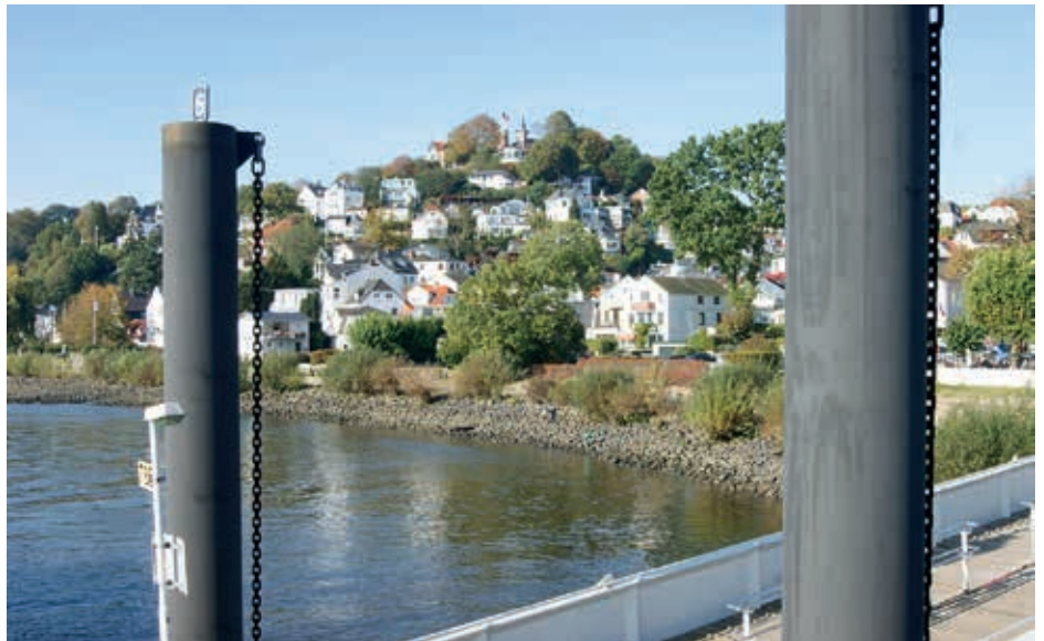
Der Süllberg heute

Seit 1837 gibt es auf dem Gipfel-Plateau ein Ausflugslokal. Zunächst schenkte man allerdings nur Milch aus. Einige Jahre später wurde dann ein Restaurant eröffnet und der heute noch bestehende steinerne Turm sowie die Terrassen errichtet. Um 1900 entstand der erste Hotelkomplex mit zehn Zimmern. In den folgenden Jahrzehnten wurde immer wieder -dem Zeitgeschmack folgend - ausgebaut und modernisiert bis dann im Jahre