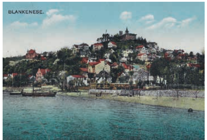
Der Süllberg um 1930, Postkarte

Nach der Zerstörung der Burg Adalberts lag der Berg wohl zwei Jahrhunderte ungekrönt. Um das Jahr 1258 sahen sich jedoch die Grafen Johann und Gerhard von Holstein durch ein „dringendes Bedürfnis“ veranlasst, auf dem Hügel, der jetzt „Sulleberg“ hieß, eine neue Burg zu bauen. Dieses dringende Bedürfnis bestand wohl darin, dass der neue Erzbischof von Bremen wieder an Macht gewonnen hatte, auch im Umfeld der wichtigen Fähre über die Elbe. Um seinen Machtgelüsten entgegenzutreten, bauten die Grafen von Holstein diese neue Burg.