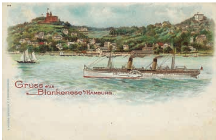
Der Süllberg aus Sicht eines Malers, vor dem 2. Weltkrieg

(Quellen: Richard Ehrenberg, Aus der Vorzeit von Blankenese, Hamburg 1897. Hamburg Lexikon, Zeiseverlag, o.J. Internet.)