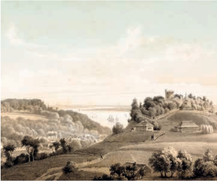
Der Süllberg in alter Zeit

und beabsichtigte eine Vereinigung von Gott Dienenden dort zu bilden, eine Vereinigung, die aber bald in eine Räuberbande sich verwandelte, denn von dieser Burg aus begannen etliche von unseren Landsleuten die Umherwohnenden, welche sie zu schützen bestellt waren, zu plündern und zu verfolgen.“