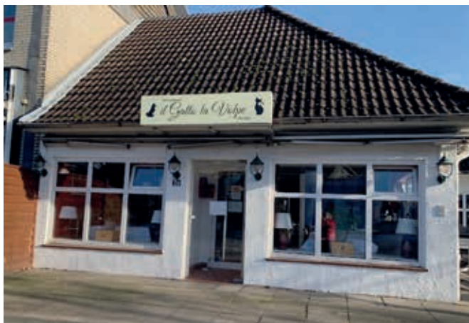
Das Restaurant mit dem neuen, leider noch falschen, Schild

Hauswand. Ein neuer Italiener in Nienstedten?