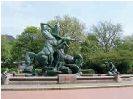
Stuhlmannbrunnen an seinem heutigen Standort

Noch hält er seinen Winterschlaf mitten auf dem Platz der Republik, der majestätische Stuhlmannbrunnen, eines der Wahrzeichen Altonas. Er ist das Geschenk eines reichen Altonaer Bürgers an seine Vaterstadt; des Gründers der Altonaer Gas- und Wasseranstalt AG, Günther Ludwig Stuhlmann. Über ihn ist nicht allzu viel bekannt. Er wurde 1797 in Neumühlen geboren und starb 1872 in Nizza. Seine Familie besaß eine Kalkbrennerei in Neumühlen am Elbstrand, unterhalb der Rainville Terrassen. Dieses Gelände bildete den Grundstock für den späteren Reichtum Stuhlmanns. Sein Lebensweg ist nicht genau nachzuvollziehen. Er hat eine Zeit in Wandsbek und Hamburg gewohnt und war viel auf Reisen. Auf diesen hat er sich intensiv mit der neuesten Technik der Gas- und Wasserversorgung in mehreren Ländern beschäftigt und wurde zu einem anerkannten Fachmann auf diesem Gebiet.