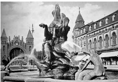
Stuhlmannbrunnen am alten Platz 1912, im Hintergrund Bahnhof Altona und Hotel Kaiserhof

In seiner Heimat Altona war man schon seit langem bemüht, die Stadt mit Gas für die privaten und öffentlichen Gebäude zu versorgen und die Straßenbeleuchtung auf moderne Gaslaternen umzustellen. In diesem Zusammenhang fiel den Verantwortlichen auf, dass auch eine, den modernen Ansprüchen genügende, Wasserversorgung fehlte. Die Stadtväter beschlossen daher, beide Aufgaben zusammen anzugehen, sie jedoch nicht aus öffentlichen Mitteln zu finanzieren, sondern der „Privatspeculation“ zu überlassen. Es gab eine Ausschreibung, den Zuschlag erhielt Stuhlmann zur Errichtung eines Wasser- und eines Gaswerkes auf seinem Gelände in Neumühlen. Allerdings stellte sich recht bald heraus, dass das Gelände in Neumühlen wegen der Nähe der Abwassersiele Altonas und Hamburgs denkbar ungeeignet war.