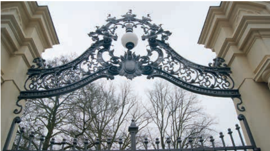
Der schmiedeeiserne, reich verzierte Bogen des Tores

sind zu unterschiedlichen Zeiten entstanden. Den Zugang an der Holztwiete ließ Martin Johann Jenisch 1828 anlegen, um aus der Stadt Kommenden eine attraktive Zufahrt zu seiner Villa zu geben. Hier stand damals das schmiedeeiserne Tor, das 1957 an den Eingang an der Baron-Voght-Straße versetzt wurde. Dort befand sich nur ein einfacher Durchlass, den Caspar Voght 1789 bei den Instenhäusern, seinem Landhaus gegenüber, hatte. Und dann erfährt man noch, dass der Park früher nicht jedem zugänglich war, man eine Einlass-Karte besitzen, die Gärtner um Einlass bitten oder Eintritt bezahlen musste.