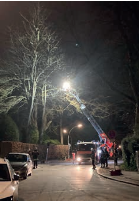
Nachteinsatz in der Charlotte-Niese-Straße

Freiwillige Feuerwehr Nienstedten hieß dies: Einsatz. 16-mal musste die Wehr ausrücken. Mal waren es gelöste Äste, die es zu beseitigen galt, mal ganze Bäume, die quer auf der Straße lagen oder die Autos unter sich begraben hatten. „Glücklicherweise handelte es