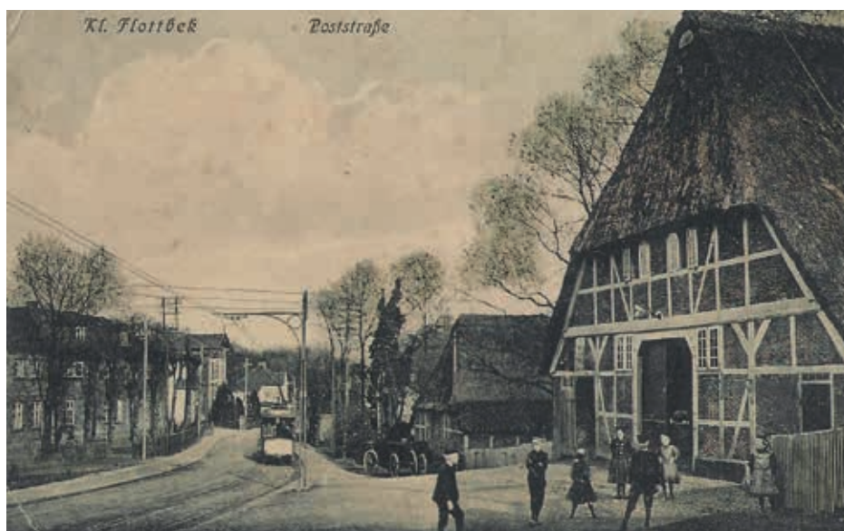
Die Straßenbahn in der ehemaligen Poststrasse (heute Hochrad, 1900). Links heute das Restaurant „T'on Peer Stall“

... Die Wagen sind 11,5 m lang, 2 m breit und 3,4 m hoch und haben im Innern 30 Sitzplätze auf zwei Längsbänken und ausserdem auf den Perrons noch neun Stehplätze. Es laufen 16 Motorwagen ohne Anhängewagen, die sämtlich in den Werkstätten der Hamburger Strasseneisenbahngesellschaft in