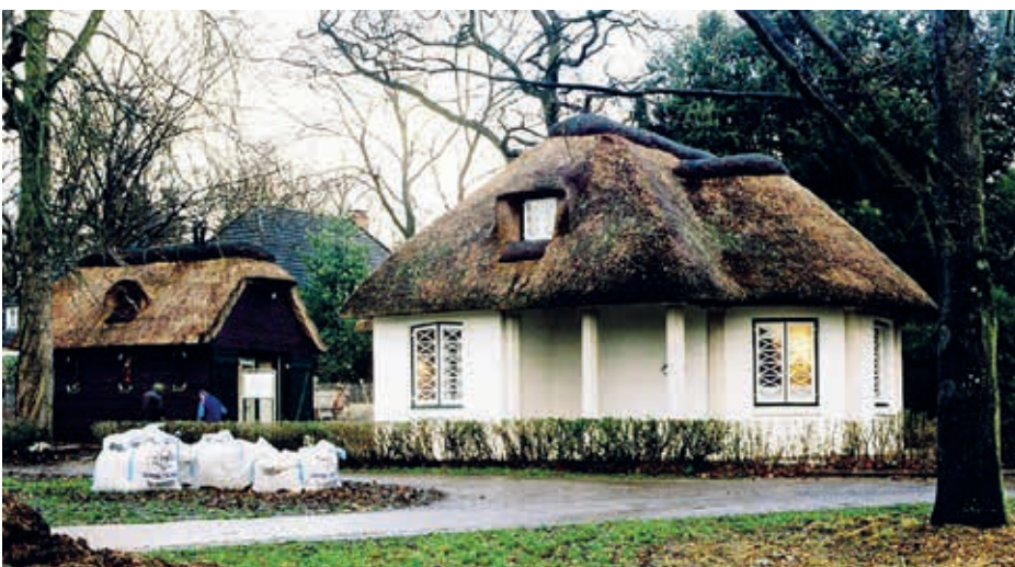
Das schmucke Pförtnerhäuschen in der Holztwiete