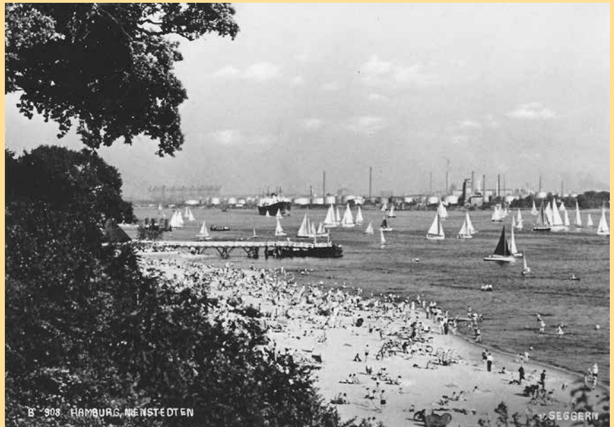
Der Nienstedtener Elbstrand in den 1950er Jahren