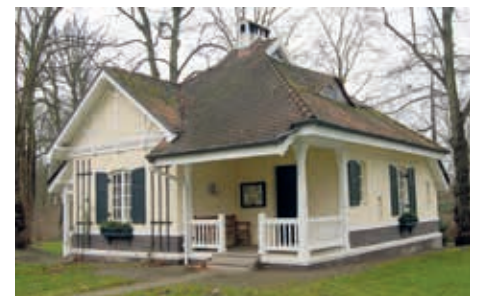
Das Pförtnerhäuschen hinter dem Kaisertor

Baron Jenisch ließ das Tor 1906 anlässlich des Besuches Kaiser Wilhelms II. im neobarocken Stil errichten. Deshalb auch der Name. Kurz vorher hatte der Kaiser seinen Diplomaten Jenisch, in den Freiherrenstand (Baron) erhoben. Die beiden anderen Eingänge zum Park an den Instenhäusern und der Holztwiete waren ihm wohl nicht dem Anlass entsprechend gestaltet. Gleichzeitig wurde dem neuen Tor noch ein zeitgemäßes Parkwärterhaus hinzugefügt (das dritte im Bunde) und zwar im Schweizer Fachwerkstil mit Log-