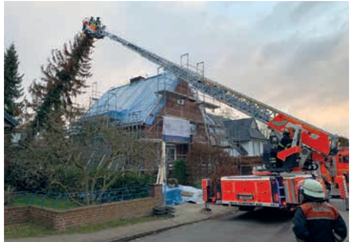
Erster Einsatz am Sonntag früh in der Thunstraße

Der Höhepunkt des Sturms war für die frühen Morgenstunden am Sonntag vorhergesagt worden. Allerdings gab es schon davor jede