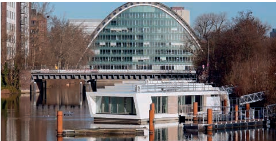
Der „Berliner Bogen“ mit Hausbooten (W. Mainhart, Hamburg)

mehrere Theorien. Die einleuchtendste: Hier lag einst eine Wachstation außerhalb des Stadtgebietes und war wegen der abgeschiedenen Lage bei den Wachsoldaten äußerst unbeliebt. Nachts war der Posten besetzt und im Morgenrauen, beim ersten Hühnergeacker, verließen ihn die Wachleute so schnell wie möglich. Das heute hier stehende, gewaltige, mittelalter-