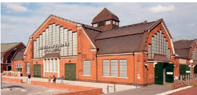
Die Deichtorhallen heute

Im Zweiten Weltkrieg wurde Hammerbrook in der Nacht vom 27. auf den 28. Juli bei Luftangriffen, die als Operation Gommorha in die Geschichte eingegangen sind, so gut wie ausgelöscht. Es gab fast 12000 Tote, und die Gegend war so stark zerstört, dass man den Stadtteil zur Sperrzone erklärte und ihn mit einer