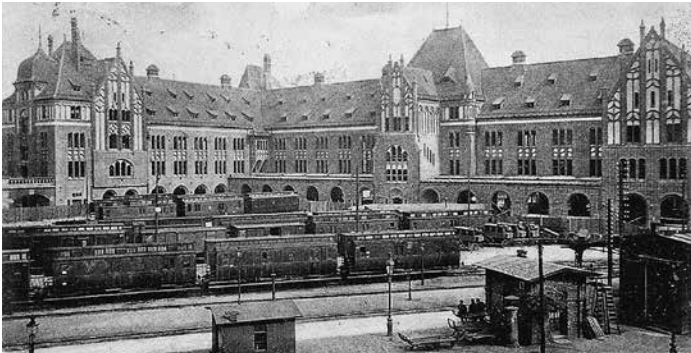
Der „Hühnerposten“, 1904

Hammerbrook mag auf den ersten Blick nicht besonders reizvoll für einen Ausflug erscheinen. Der Stadtteil hat jedoch viel mehr zu bieten als graue und teilweise triste Industrie oder Gewerbehöfe.