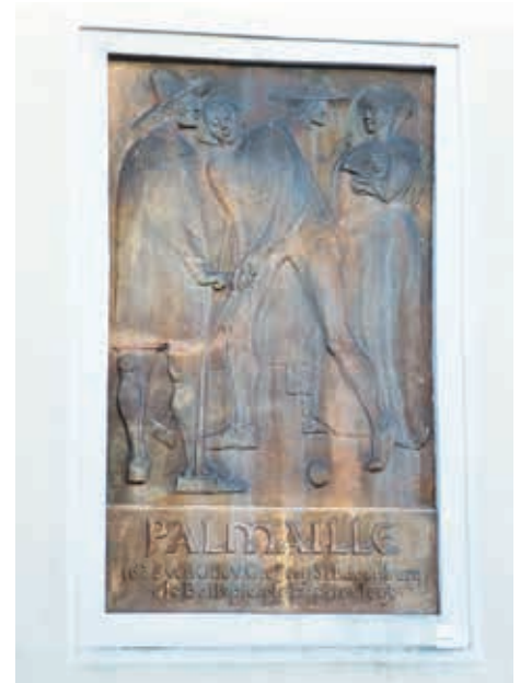
Palmaille-Relief von K.-A. Ohrt