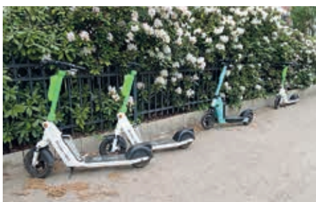
Geparkte E-Scooter in der Jürgensallee

Sie erobern seit 2019 geräuschlos unsere deutschen Großstädte. In Hamburg sind davon zurzeit rund 4.000 unterwegs, befördern Touristen, Jugendliche, die mal etwas Spaß haben wollen aber auch Erwachsene, die nach Feierabend zwischen unseren zwei S-Bahnhö-