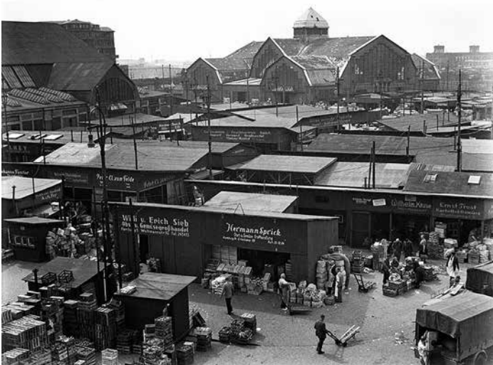
Die Deichtorhallen mit Gemüse- und Früchtemarkt

der Deiche. Der große Hamburger Brand von 1842 brachte zwar großes Unglück über die Hansestadt, im Brook jedoch halfen die Trümmer der Katastrophe, die dort massenhaft aufgeschüttet wurden, bei der endgültigen Trockenlegung.