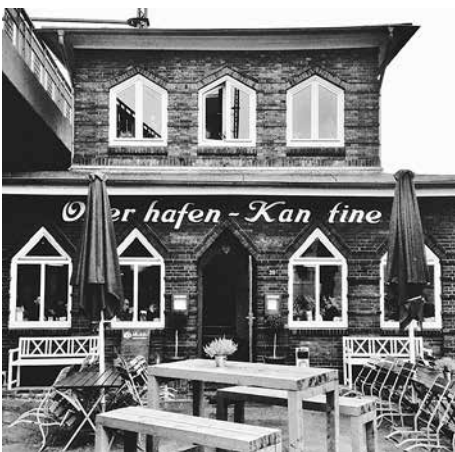
Die legendäre Oberhafen-Kantine

Auf dem Gebiet der Deichtorhallen umgaben einst die Wallanlagen die Innenstadt und durch das Deichtor gelangte man in das südöstliche Umland. 1912 errichtete man hier wegen der guten Anbindung an Hafen und Hauptbahnhof den Deichtormarkt mit mehreren großen Hallen. Auch diese waren bald zu klein und so entstand nicht weit entfernt der neue Großmarkt. Die Deichtorhallen selber dienten bis in die 1980er Jahre noch als Blumenmarkt, standen danach aber einige Jahre leer. Durch das Engagement