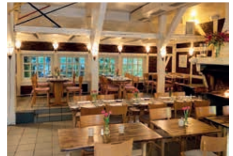
Das Restaurant im neuen Gewand