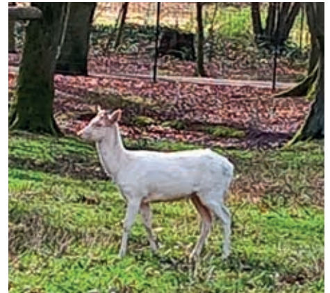
Hellmut auf dem Weg zu seinen Artgenossen