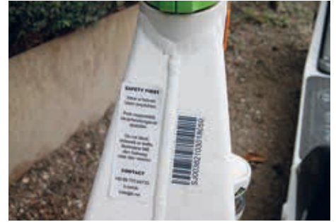
Hinweise fürs richtige Verhalten

In der Regel beträgt die Grundgebühr 1 Euro und die Leihminute 15 – 20 Cent. Eine Stunde kann über 10 Euro kosten. Tagespauschalen sind dann günstiger. Das Ausleihen wird über die App beendet. Auf der Karte kann man sehen, ob man sich innerhalb der Business-Zone befindet. Wenn man den Roller außerhalb dieser Zone abstellt und sich abmeldet, wird eine Umzugsgebühr fällig. Man sollte an das verkehrsgerechte Abstellen denken, denn bei Behinderung von Fußgängern oder Radfahrern kann man, wie bereits erwähnt, belangt werden.