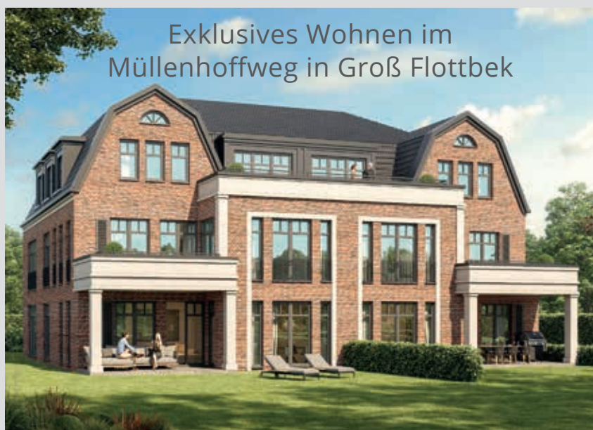
Exklusives Wohnen im Müllenhoffweg in Groß Flottbek