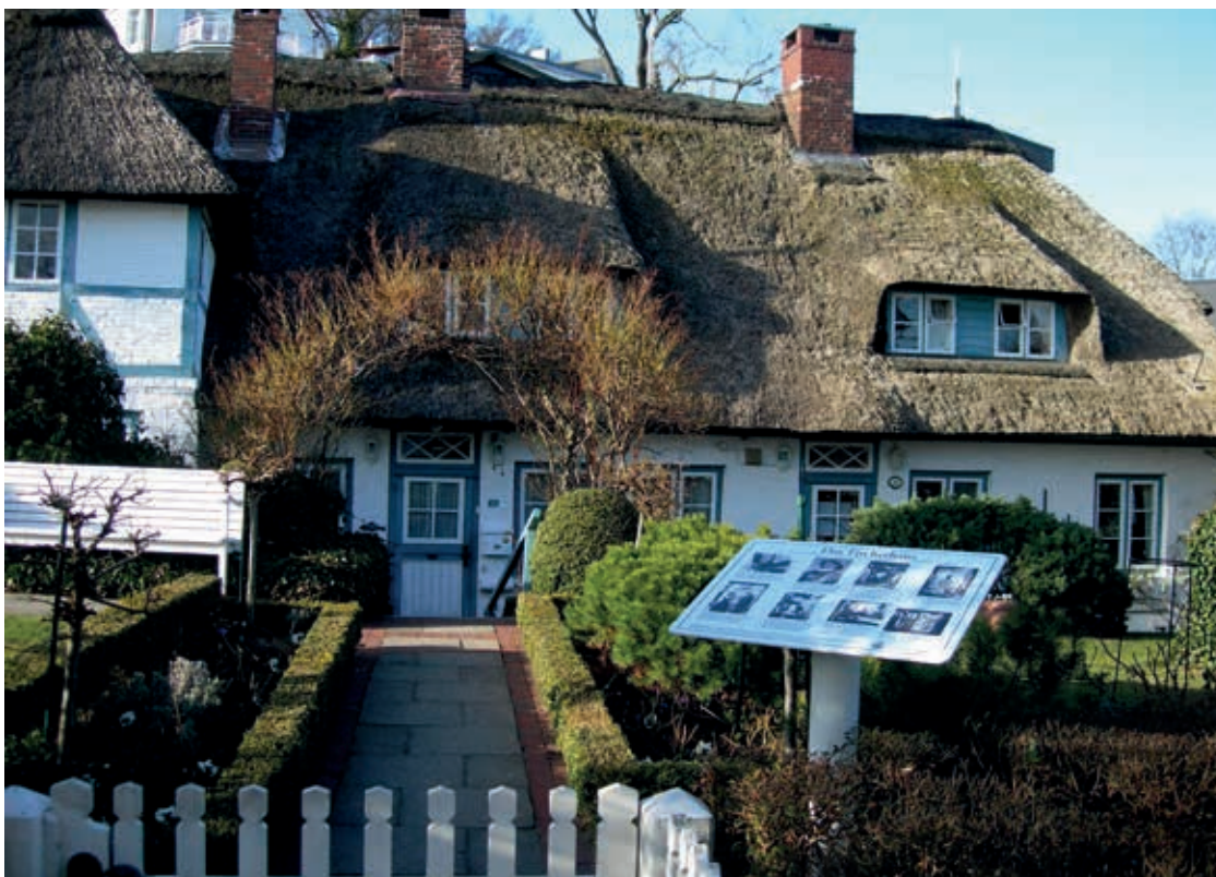
Das Fischerhaus, aufgenommen im März 2011

Die Sprinkenhof Gesellschaft wurde vom Bezirk Altona beauftragt, das Fischerhaus unter Beachtung bauhistorischer Vorgaben wieder instand zu setzen. Dazu gehören unter anderem die Außenfassade, das Fachwerk, die Geschosdecken und das Dach. Die historischen Fenster und Türen sollen, soweit möglich, denkmalgerecht saniert oder nachgebaut werden. All diese Sanierungsmaßnahmen sollen im Frühjahr 2023 abgeschlossen sein. Die Mieter der Wohnung können dann wieder einziehen und die Kirchengemeinde wird wieder